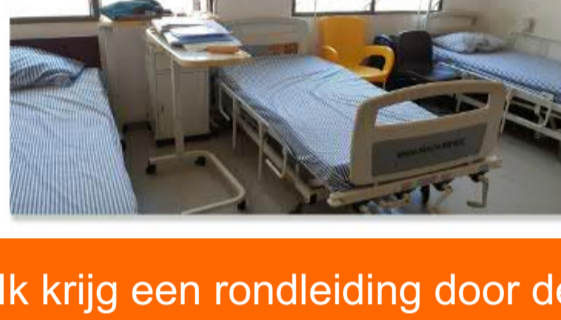
Ik krijg een rondleiding door de hele kliniek, die er erg verzorgd uit ziet. Alle kleine behandelingen zoals malaria, hiv, bevallingen e.d kunnen in deze kliniek worden uitgevoerd.