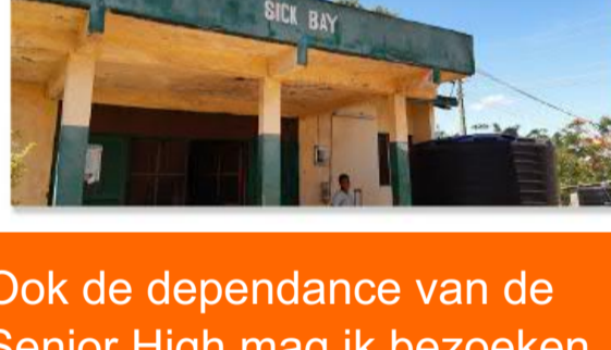
Ook de dependance van de Senior High mag ik bezoeken. Dit is uniek want gasten zijn maar een weekend per maand welkom.