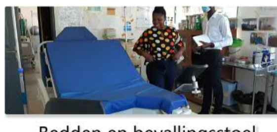
Bedden en bevallingsstoel in de kliniek