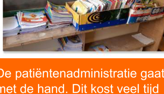
De patiëntenadministratie gaat met de hand. Dit kost veel tijd waardoor inkomsten via de verzekering te lang op zich laat wachten. Ook worden er fouten gemaakt. Soms zijn dossiers niet vindbaar en wordt er een 2e dossier aangemaakt. Dit kan gevolgen hebben voor de patiënt, vooral als er medicijnen worden gebruikt.