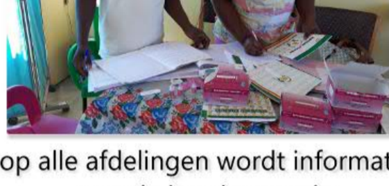
op alle afdelingen wordt informatie met de hand verwerkt