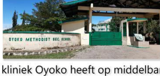
kliniek Oyoko heeft op middelbare scholen een eigen afdeling